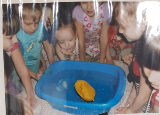
Что такое айсберг?